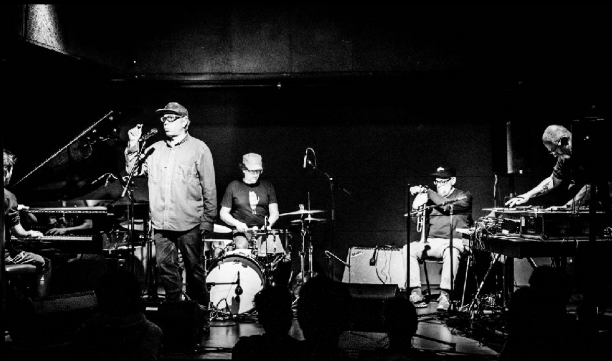
Cave12, Geneva (CH), 01.2024