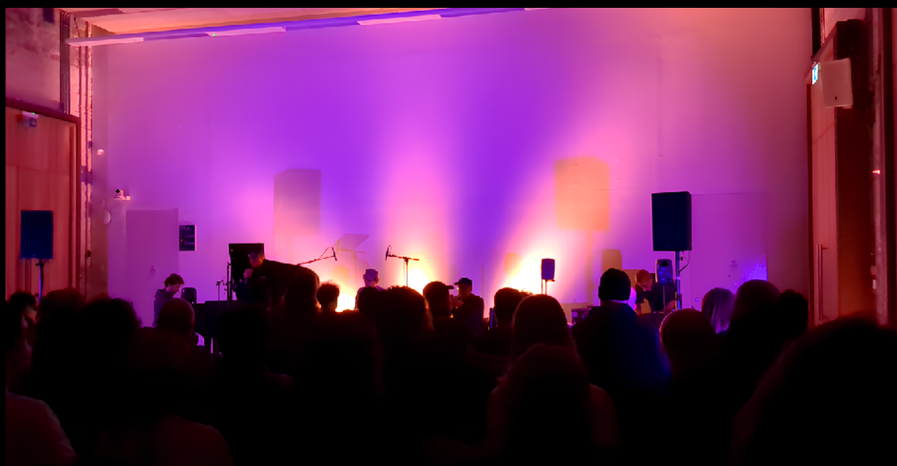
Reid School Of Music, Edinburgh (UK), 01.2024